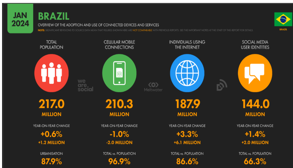
Figura 2 - Visão geral da adoção e uso de dispositivos e serviços conectados no Brasil

Brasil - O estado do digital no país aponta que mais de 86% dos brasileiros têm acesso a internet. Já as conexões móveis celulares somam 210,3 milhões. Valor equivalente a 96,9% da população. O país tem 144 milhões de usuários nas mídias sociais. O que equivale a 66,3% da população. Há diferenças entre países no que diz respeito ao tempo gasto na utilização das redes sociais. O Brasil, por exemplo, se apresenta acima da média e ocupa o terceiro lugar com 3 horas e 37 minutos nas redes sociais. Atrás somente do Quênia e dos sul-africanos. Os usuários da internet se aproximam rapidamente do status de “supermaioria” – quando dois terços da população mundial estão online. Com isso, há um número cada vez menor de pessoas que permanecem offline.